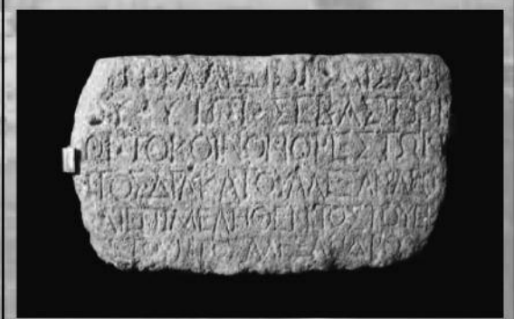
ΤΟ ΚΟΙΝΟΝ ΟΡΕΣΤΩΝ

Έτος 22ο - Απρίλιος 2012 - Ιστορική, Πολιτισμική Μηνιαία Εφημερίδα Άργους Ορεστικού - Αρ. Φύλλου 252 - Τιμή 0,20 ευρώ - Κωδικός 1190